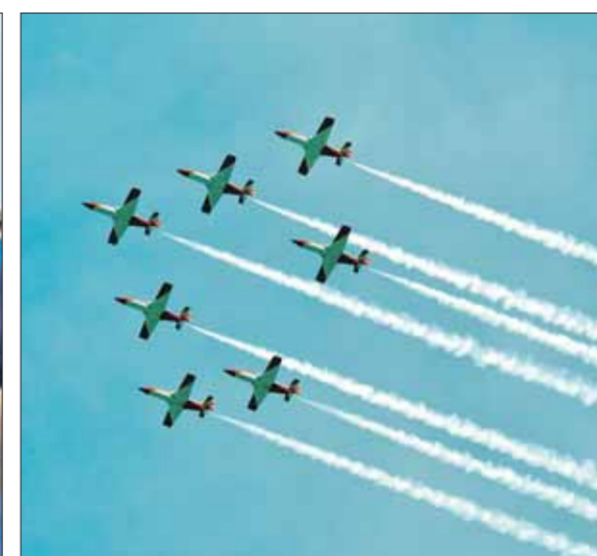
Los F-5 divertieron a todo el público.