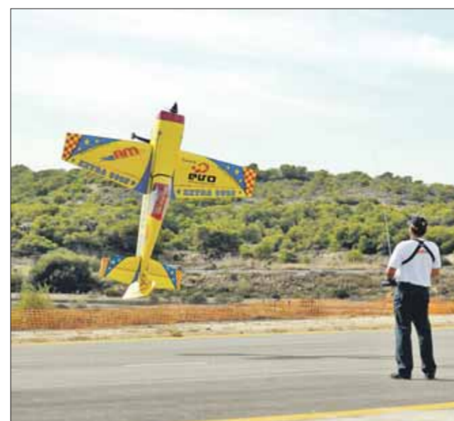
Antes de todo, hubo una exhibición de aeromodelismo.

el descubrimiento de un monolito y el cambio de la denominación de las instalaciones del campo de vuelo del municipio.