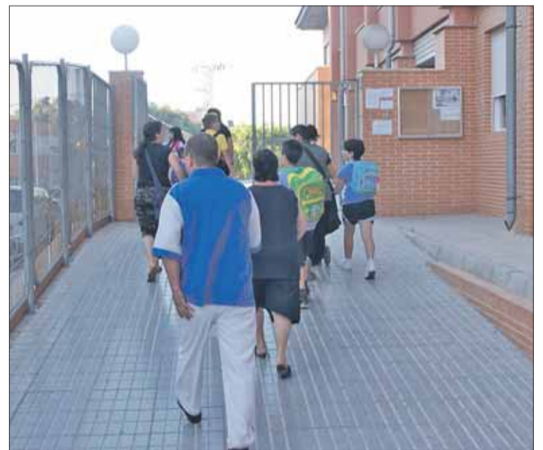
Los centros elegirán a sus representantes.

las AMPAS. Asimismo, lo integran de cinco a dos representantes de alumnos, teniendo en cuenta que en el ciclo de primaria sólo participan niños a partir de nueve a diez años; un representante del personal de administración y servicios; el secretario del centro que actúa como secretario y un representante del Ayuntamiento. En Guardamar se espera una alta participación.