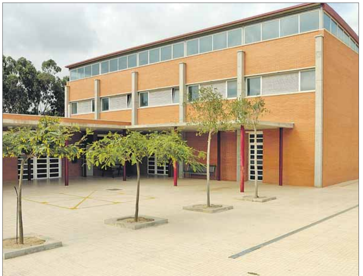
Imagen del Colegio Reyes Católicos, centro educativo público de Guardamar, participante en estas elecciones.

Los centros educativos de Guardamar esperan una alta participación en las elecciones del 29 de noviembre