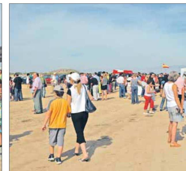
Familiares y amigos no faltaron.