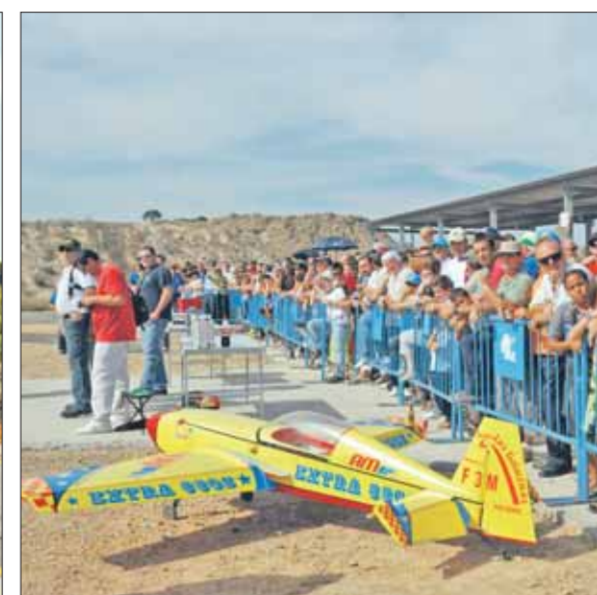
Masiva afluencia de público durante la jornada.