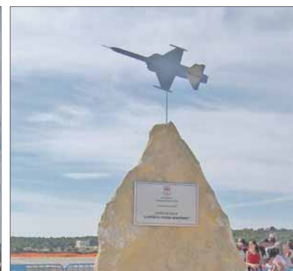
La placa y la réplica del F-5.