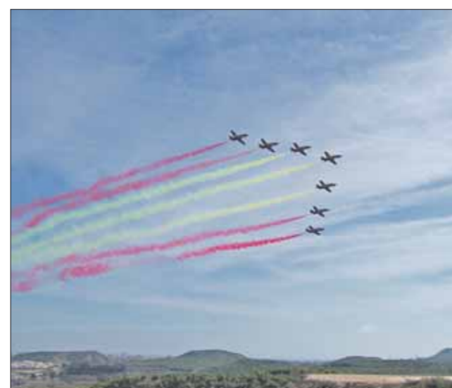
Colorido y espectacularidad.