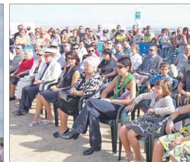
La alcaldesa encabezó el acto.