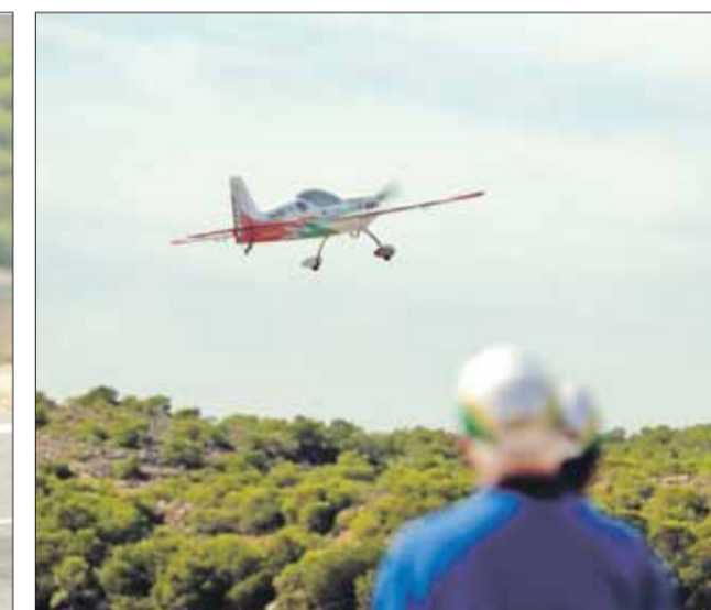
La jornada fue atractiva.