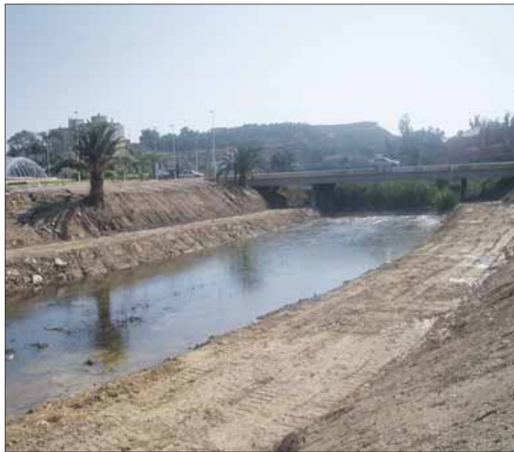
Imagen del río Segura a la entrada de Guardamar.

Tras las lluvias los cítricos y las hortalizas alcanzarán un calibre y calidad especiales, pues estos cultivos se han podido recuperar.