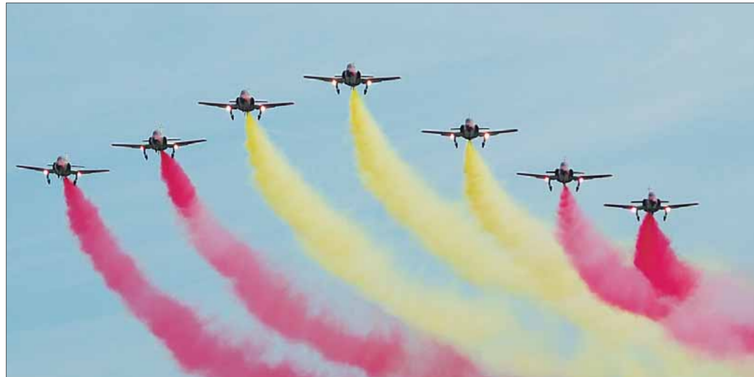
Los F-5 volaron por encima de Guardamar para rendir homenaje a uno de sus ex compañeros.

Se contó con una exhibición de la Patrulla Águila del Ejército del Aire por encima del campo de vuelo y de las playas de Guardamar. Los espectaculares F-5 realizaron formaciones increíbles con humo de colores en