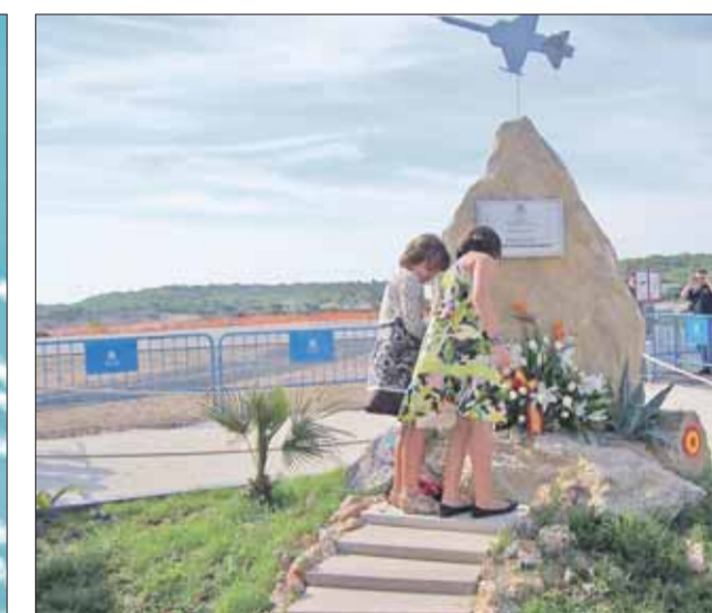
Momento en que las hijas descubren el monolito.