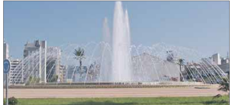
La fuente del acceso norte, en funcionamiento durante la anterior semana.

La fuente del acceso norte ha reanudado su funcionamiento desde que el pasado mes de agosto unos de vandalismo provocaron su rotura. El principal daño recayó en el centro electrónico de la instalación, la pieza más costosa. memoria que controla, por ejemplo, el nivel del agua y los cambios de altura de los chorros.