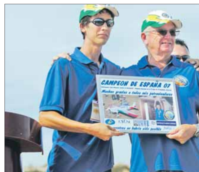
Se homenajeó al vigente campeón de España de Aeromodelismo.