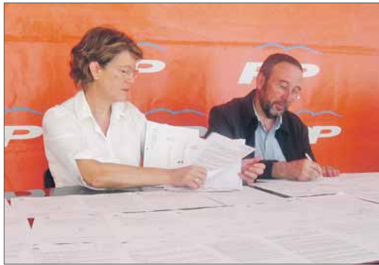
Rueda de prensa del PP el martes, donde muestran los escritos no presentados.

Finalmente, el Grupo Municipal Popular advierte de que «la Alcaldesa ha vetado personalmente el acceso de nuestros concejales