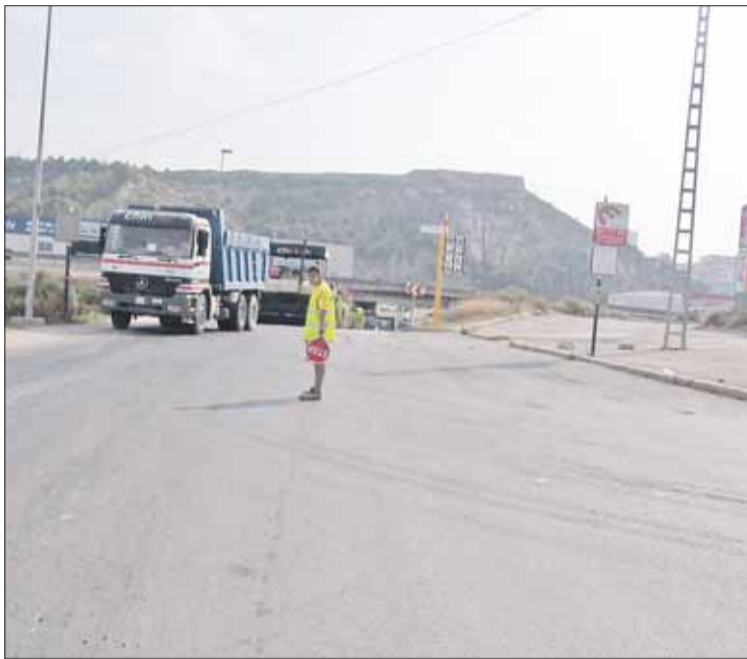
El gobierno valenciano está invirtiendo en Guardamar.

En último lugar, para el acabado de la urbanización del Polígono