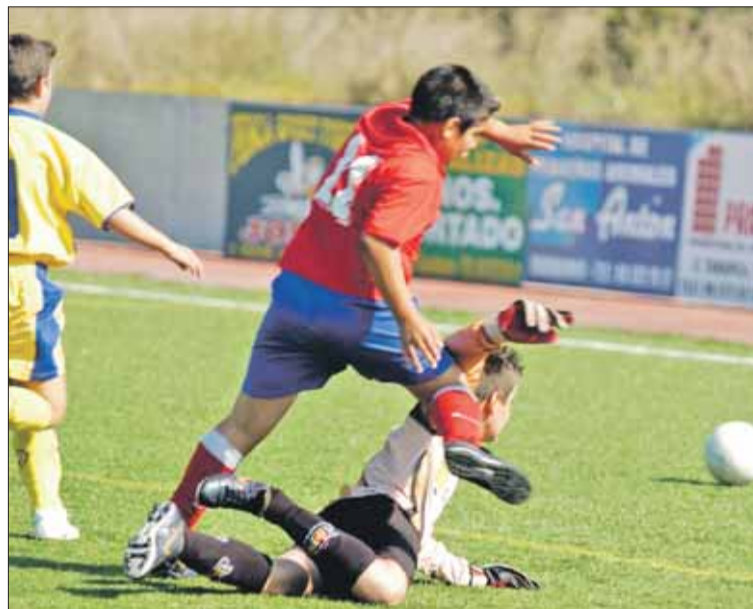
El fútbol base ha comenzado con buen pie la temporada 2007-08

La cantera del Alone está cosechando en este inicio de temporada unos resultados muy destacados como el logrado por el benjamín, que en esta pasada jornada le endosaba al Horadada un 0-15. Los futuros jugadores del Alone no tuvieron piedad ante los pilareños, que nada pudieron hacer para remediar dicha goleada de escándalo. Para el próximo fin de semana, los benjamines recibirán en Las Rabosas al Intango D.