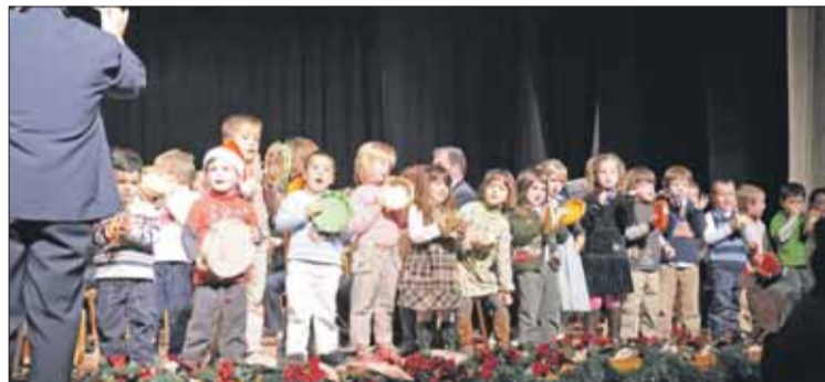
Los niños del Jardín Musical tocan y cantan villancicos.

El tradicional Concierto de Navidad se realizó el domingo 16 en Casa Cultura. El concierto se dividió en cuatro partes: en la primera, mientras la Agrupación tocaba, los niños del Jardín Musical cantaron villancicos; en la segunda, cantó la Coral Aromas de Guardamar; en