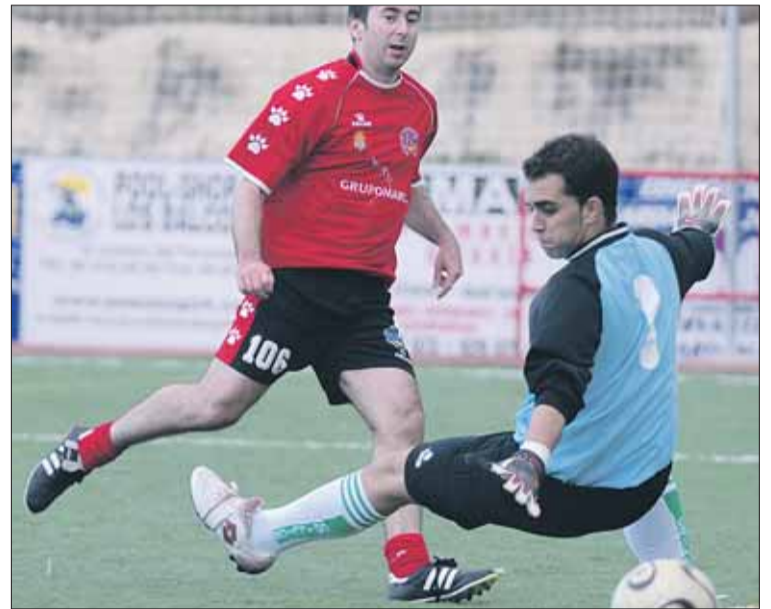
Uno de los goles del Alone de Veteranos.

El pasado domingo se disputó la tercera edición del trofeo de Veteranos entre el Alone y el conjunto Illice de Elche. El encuentro acabó en empate a dos goles, pero en la tanda de penaltis los guardamarencos derrotaron a los franjiverdes. Por parte del Alone