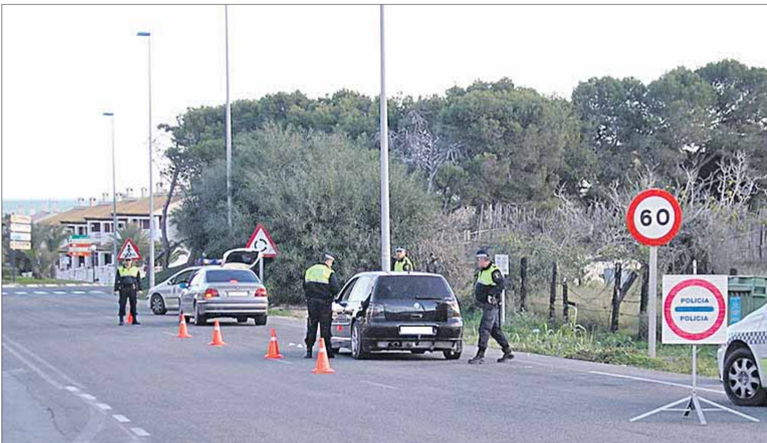
Parte del turno de noche pide mejoras y mayor número de agentes para cubrir las demandas del municipio.

Los sindicatos CSI-CSIF y SPPLBCV denuncian la situación en la que se encuentra el 50% de la plantilla del turno de noche y solicitan mejoras