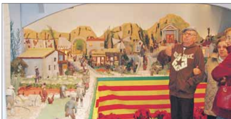
Varios visitantes comentan las mejoras con que el belén cuenta este año.

Tras el Pregón de Navidad, el 8 de diciembre se inauguró el Belén, ubicado en la Casa del Ingeniero Mira con acceso por la calle Miguel Hernández.