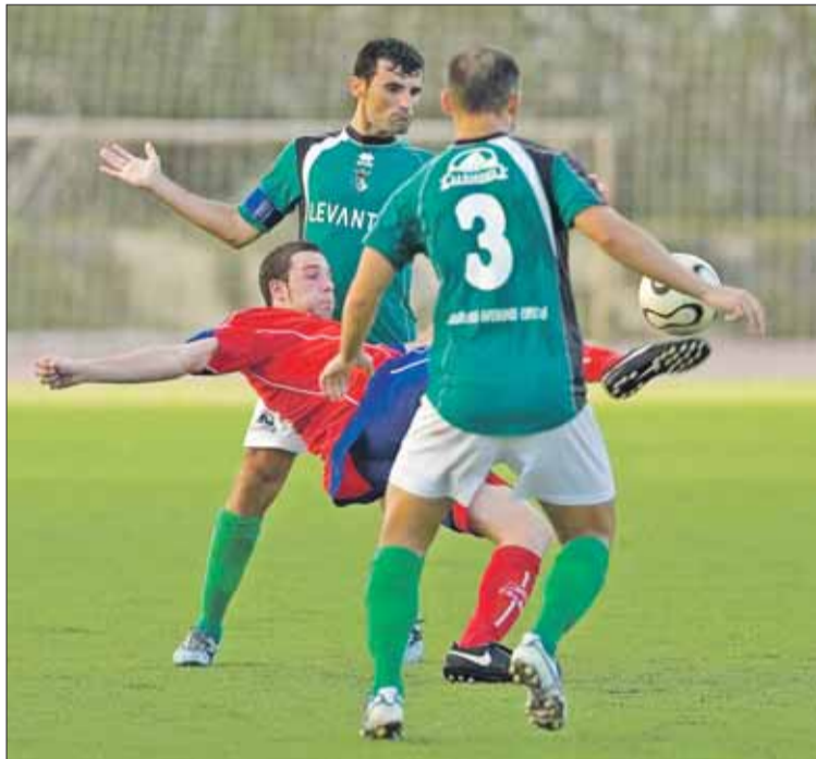
El Alone debe ganar para no entrar en problemas.