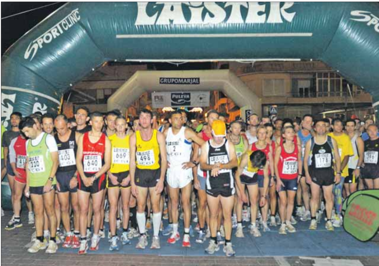
Momentos de la salida de los corredores senior y veteranos.

Cerca de un millar de atletas tomaron la salida en una carrera organizada por el Club Maratonianos.