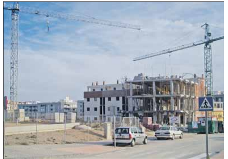
La zona del cementerio acoge un importante proceso de urbanización.