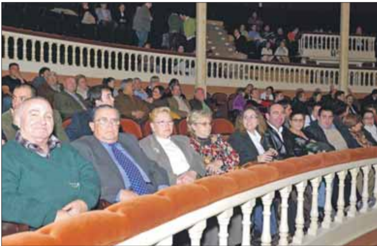
Simpatizantes y ediles guardamarencos del PP en el Teatro Circo de Orihuela.