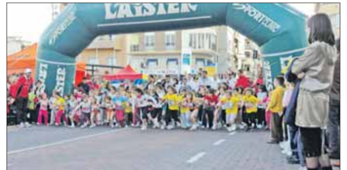
También hubo carrera para los más jóvenes.