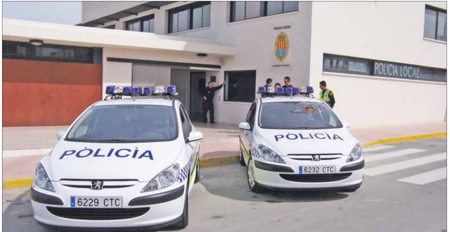
Dependencias de la Policía Local de Guardamar.

Los sindicatos CSI-CSIF y SPPLBCV, denuncian la situación en la que se encuentra el 50% de la plantilla del turno nocturno de la Policía Local de Guardamar del Segura. Según ha podido saber este medio, las diferencias económicas con los compañeros del turno de día son mínimas, pero sobre todo, se carece de personal suficiente para cubrir las demandas de la localidad como puede ser el Polígono Sup-7, donde ya no se patrulla con la frecuencia que se merece por falta de medios humanos. Precisamente este es uno de los puntos más conflictivos del municipio al estar allí la zona de ocio, pero según hemos podido saber, los agentes deben atender otras incidencias que se producen en el municipio. Por este motivo, estos sindicatos solicitan más número de agentes y mejoras económicas dadas las condiciones de trabajo de este turno de noche. Tras varios intentos de negociación con el Consistorio para ver atendidas sus demandas laborales, "y ante la pasividad y desatención mostrada hacia tales reivindicaciones", han solicitado en bloque y por medio de escrito presentado en registro de entrada del ayuntamiento dirigido a la Alcaldesa, el pase a los turnos