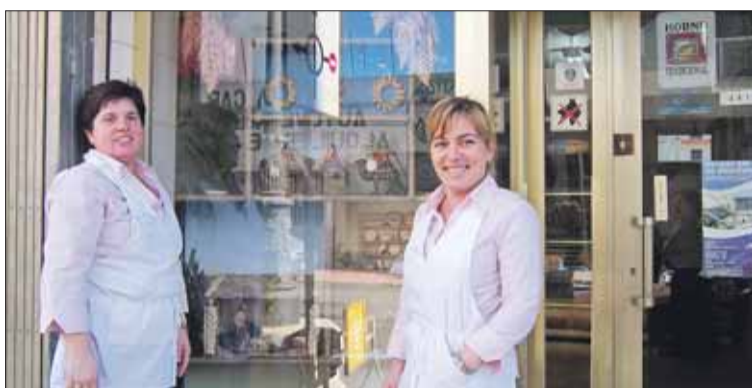
Empleadas de la Boutique del Pan posan junto al escaparate ganador.

Con un éxito de participación que duplica al de otras ediciones, un total de 44 comercios participaron en esta cuarta edición del concurso de escaparates, que pretende crear un ambiente comercial típico de estas fechas.