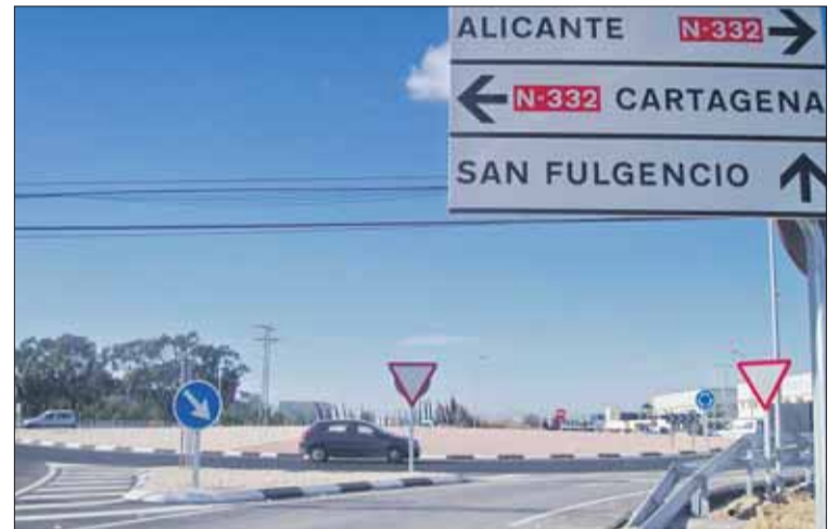
Aunque la señal de tráfico no lo demuestra, la rotonda es ya una realidad.

La "peligrosa" maniobra que debía hacerse en la N-332 para dirigirse a San Fulgencio es historia, puesto que ya ha sido ejecutada la rotonda que conecta Guardamar con el municipio vecino por la nacional.